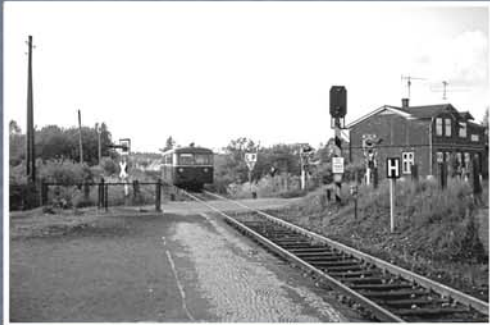
▲ Zug bei der Einfahrt nach Barkhorst von Norden kommend (1966)

Im Kreis Stormarn entstand danach auf der alten Bahntrasse ein hochwertig ausgebauter Radwanderweg.