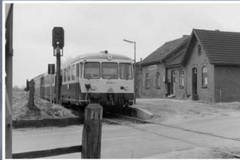
▲ Akku-Triebwagenzug im Bahnhof Barkhorst (1976)