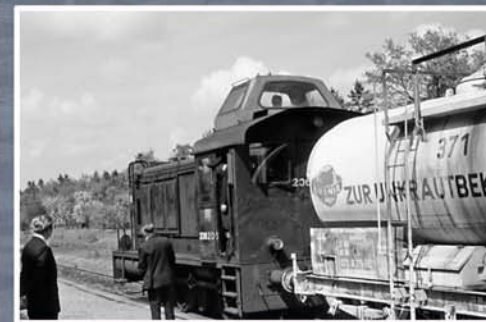
▲ Unkrautbekämpfungszug (1970)

◀ Die Route B ist Teil eines Netzes von Radwegen auf ehemaligen Bahntrassen in Stormarn. Auch auf der Route A zwischen Bad Oldesloe und Henstedt-Ulzburg im Kreis Segeberg (EBOE-Trasse) und auf der Route C zwischen Trittau und Glinde (Südstormarnsche Kreisbahn) sind heute hochwertige Radwege vorhanden.