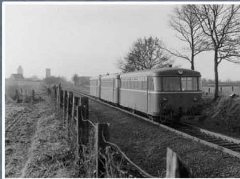
▲ Dreiteilige Schienengarnitur nördlich von Barkhorst (1976)

◀ Die Route B ist Teil eines Netzes von Radwegen auf ehemaligen Bahntrassen in Stormarn. Auch auf der Route A zwischen Bad Oldesloe und Henstedt-Ulzburg im Kreis Segeberg (EBOE-Trasse) und auf der Route C zwischen Trittau und Glinde (Südstormarnsche Kreisbahn) sind heute hochwertige Radwege vorhanden.